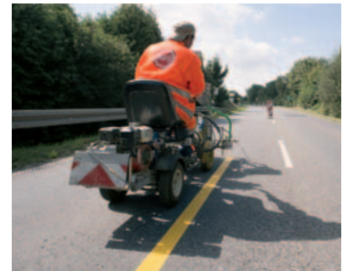
Präzise steuert der AVS-Facharbeiter die Markierungsmaschine entlang der ausgemessenen Linie und trägt so die gelbe Baustellen-Farbmarkierung akkurat auf.

Markierungsfarben sind umweltfreundlich auf Wasserbasis hergestellt und enthalten keine Lösungsmittel. Anders als bei Markierungsfolie wird kein Primer benötigt. Bei der Demarkierung fallen keine Feststoffe an, denn das Entfernen der Markierungsfarbe erfolgt mit dem AVS-PeelJet rückstandslos.