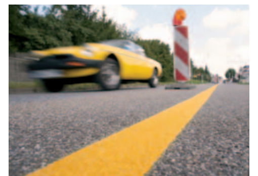
Perfekte Markierung – nach 20 Minuten bereits befahrbar!