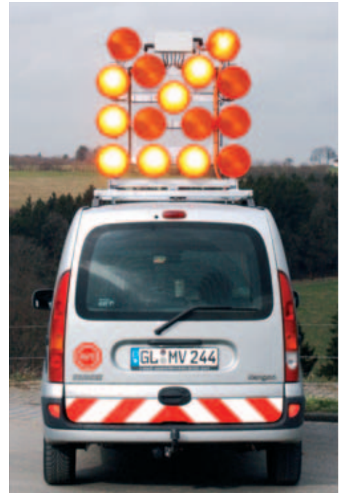
Superflacher LED-Leuchtpfeil L15 zur Absicherung der Arbeitsstelle auf neuer kompakter Hebe- und Senkvorrichtung. Beim Einschalten des Leuchtkreuzes, Pfeil links vorbei oder Pfeil rechts vorbei, richtet sich der LED-Leuchtpfeil mit seinen 15 Leuchten automatisch auf.