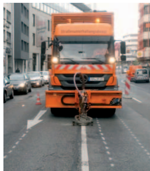
Behutsam aber gründlich wird die überflüssig gewordene Markierung entfernt ohne die Fahrbahn zu beschädigen.

Auch auf Gehwegen und Parkbuchten, teilweise auf Betonpflaster, wurde die nicht mehr benötigte Markierung mit dem AVS-PeelJet entfernt ohne die Oberflächen zu beschädigen. Aufgrund des, in jede Fahrtrichtung auf einer Fahrspur, fließenden Verkehrs und den begrenzten innerstädtischen Platzverhältnissen war wirklich Fingerspitzengefühl gefragt. Ein nicht ganz alltäglicher Einsatz, den die Demarkierungsprofis der AVS aber wieder einmal mit Bravour meisterten.