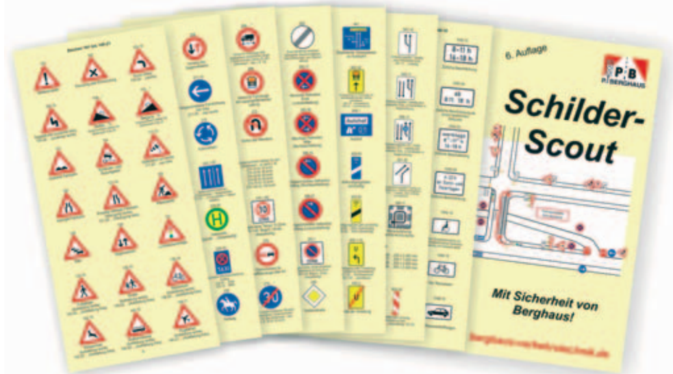
Schilder-Scout, mit nur circa 7,5 x 15 cm der praktische Helfer für die Hosentasche. Jetzt druckfrisch in der 6. Auflage bei Berghaus erhältlich – solange unser Vorrat reicht.

Ebenso ist es möglich unseren Schilder-Scout, unter Beibehaltung des Inhaltes, mit einem für ihr Unternehmen individuellen Umschlag anzufertigen. Die Mindestabnahme beträgt hierbei 1.000 Stück. Wir freuen uns auf Ihre Anfrage!