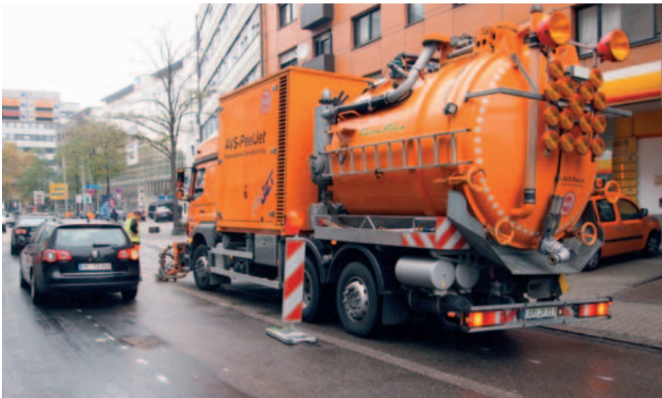
Unter Aufrechterhaltung des Verkehrs entfernt der AVS-PeelJet völlig schonend Markierungen aus Heiß- und Kaltplastik in der Innenstadt von Pforzheim, die nach einer Umgestaltungsmaßnahme nicht mehr benötigt werden.

Professionelle Demarkierung mit dem AVS-PeelJet – nicht nur auf Autobahnen erfolgreich im Einsatz: