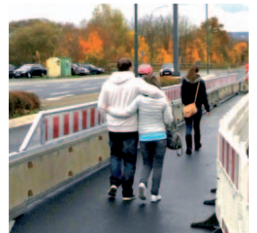
Sicherer Gehweg im Baustellenbereich: Mobile Schutzwand ProTec 120 mit Spritz- und Übersteigschutz.

Wie gut, dass Berghaus als erfahrener Hersteller und AVS als professionelle Verkehrssicherer Hand in Hand zusammenarbeiten. So kann man leicht auf Vorgaben von Behörden eingehen und den Kunden auch individuelle Lösungen anbieten.