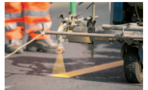
Nach dem Farbauftrag werden in einem Zug Glasperlen in die frische Farbschicht gegeben. So wird eine gute Nachtsichtbarkeit der Markierung erreicht.