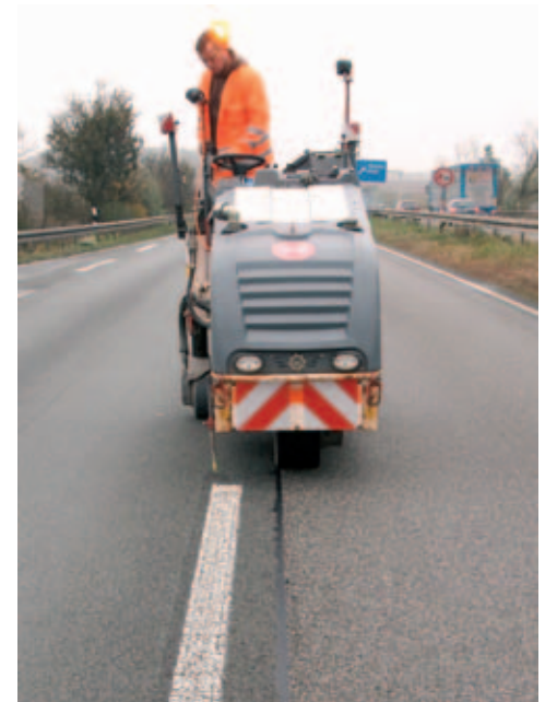
Auf Wunsch des Auftraggebers kommt im Baustellenbereich die AVS-Fräse zum Einsatz. Da die Fahrbahn nach der Baumaßnahme saniert wird, soll die im Baustellenbereich irritierende Weißmarkierung mit der Fräse abgetragen werden.