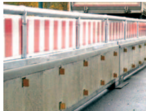
Ideal für den innerstädtischen Einsatz: Spritz- und Übersteigschutz montiert auf der mobilen Schutzwand ProTec 120.

Als Hersteller von Verkehrstechnikprodukten und mobilen Schutzwänden ist es uns natürlich möglich, für unsere Kunden individuelle Lösungen anzubieten, wie zum Beispiel bei einer Baumaßnahme auf der L3418, Westring, in Fulda.