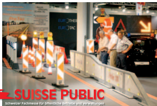
Mobiles Schutzwandsystem ProTec auf dem Messestand der Dähler Verkehrstechnik AG im schweizerischen Bern anlässlich der letzten Suisse Public im Jahr 2013.

Kommunalfahrzeuge und -maschinen, Winterdienst, Feuerwehr und Rettungsdienste, Straßenverkehr, Signalisation, Hoch- und Tiefbau, Transport uvm. Erwartet werden in Bern erfahrungsgemäß wieder über 20.000 Fachbesucher und Beschaffungsverantwortliche öffentlicher Betriebe, Verwaltungen, Bau-, Straßen- und Polizeiinspektionen sowie Berater, Fachplaner und Projektleiter von Ingenieurbüros.