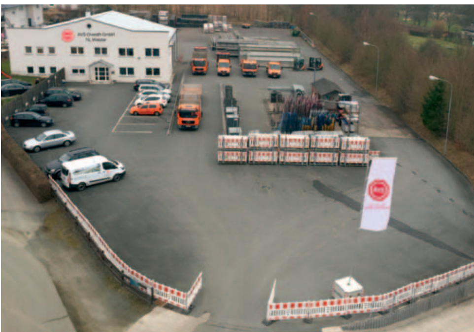
Ein Blick vom Hubsteiger auf das neue Firmengelände der AVS Niederlassung Wetzlar im hessischen Leun an der Lahn.

Neue Räumlichkeiten und ausreichend Lagerfläche gab es Ende 2014 für die Niederlassung Wetzlar der AVS Overath GmbH. Von ihrem bisherigen Standort Solms sind die Kollegen in die Nachbarstadt Leun an der Lahn umgezogen.