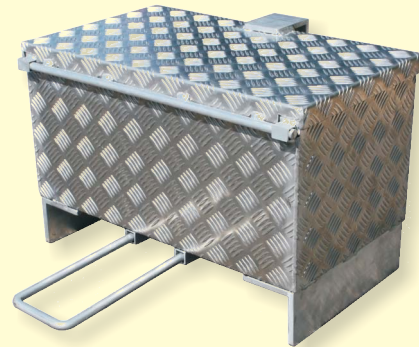
Aluminium-Akkuschutzkasten in diebstahlgeschützter Ausführung mit „Knackschutz“ für das Vorhängeschloss und mit U-Bügel zur Montage am Pfosten der Schutzplanke (auch für SuperRail) oder auf mobilen Schilderständen. Best.-Nr.: A 49590 C

Ob mobile Ampelanlagen, Leuchtpfeile oder Vorwarnblinker an Autobahnen, Berghaus Akku-Schutzkästen aus Aluminium sind für viele Anwendungen eine gelungene Alternative zu Batteriewagen oder Batteriekästen aus Kunststoff.