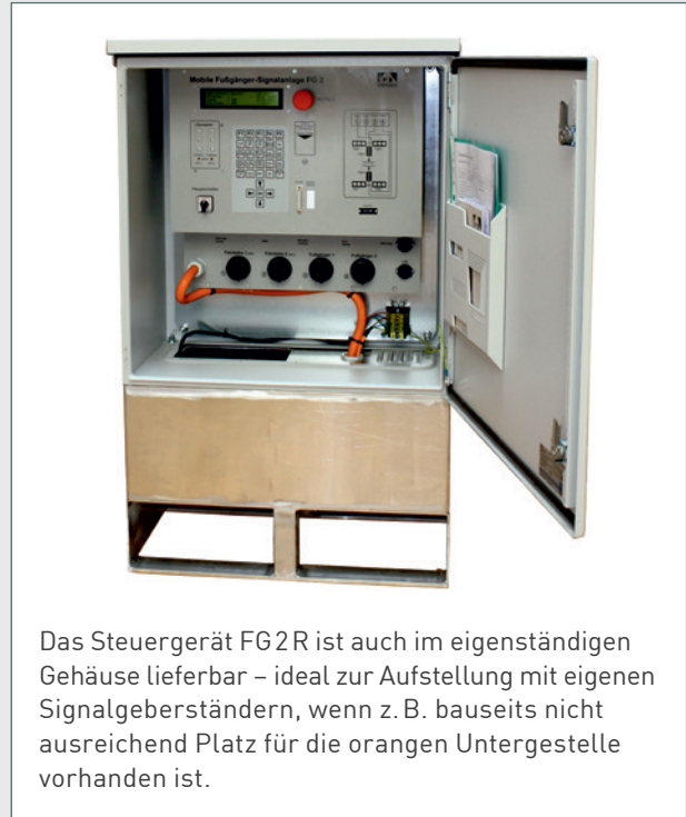
Das Steuergerät FG2R ist auch im eigenständigen Gehäuse lieferbar – ideal zur Aufstellung mit eigenen Signalgeberständen, wenn z. B. bauseits nicht ausreichend Platz für die orangenen Untergestelle vorhanden ist.

Auf Wunsch kann die Anlage mit einem Betriebstagebuch ausgestattet werden. Damit lassen sich z. B. sämtliche Anforderungen stündlich protokollieren. Zusätzlich werden alle Ereignisse, Programmwechsel, Tastaturbedienung, ein eventueller Spannungsausfall und sogar die letzten 90 Sekunden des Umlaufes vor Fehlerlösung erfasst (Blackbox). Selbstverständlich stehen diese Daten auch zum Ausdruck bereit.